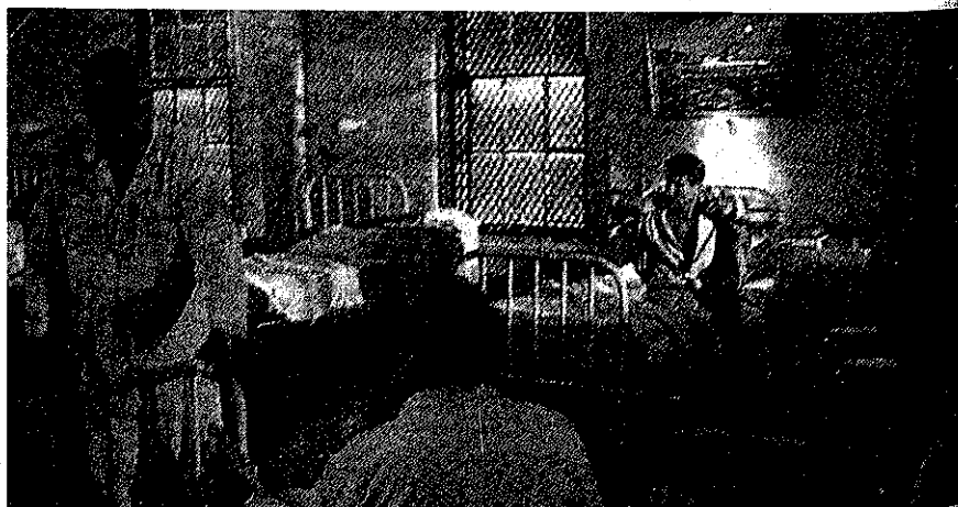
▲沙耶望著他的病人從靜止的植物性狀態中爬出……。